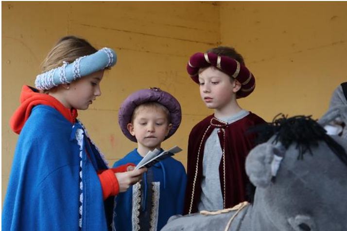
Die Heiligen drei Könige waren auch zu Gast in der Katholischen Kita Herz Jesu in Diez.